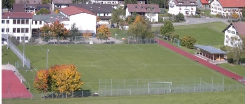
Auf der Westseite vorhandenes Flutlicht, das durch Masten auf der Ostseite ergänzt werden soll

Seit Jahren schon plagen sich die Weitnauer Fußballer mit einer völlig unzu-reichenden Flutlicht-anlage auf dem Schulsportplatz herum. Die Anlage erlaubt nur eine einseitige Aus-