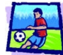
Tabelle 2. Mannschaft:

„Oole ole ole Kurort am Hauche wir lieben unsere Heimat nur der TVW“